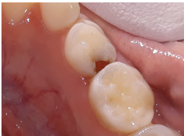
Hul i mælkekindtand

Når der går hul i en mælketand, så sliber vi tandens kanter, så I nemmere kan komme til at børste ved hullet 2 gange om dagen.