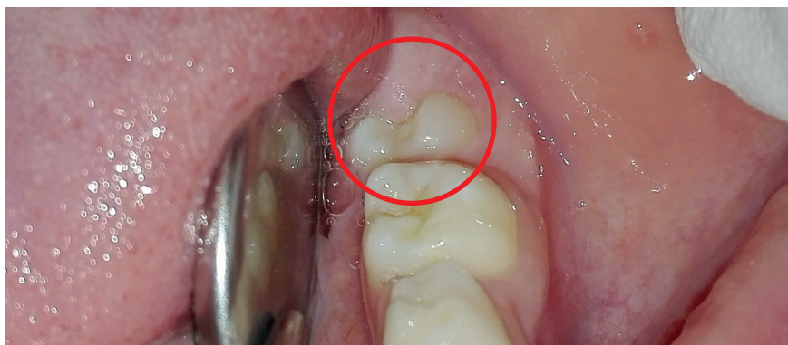
Her kan du se en 12 - årstænder på vej frem