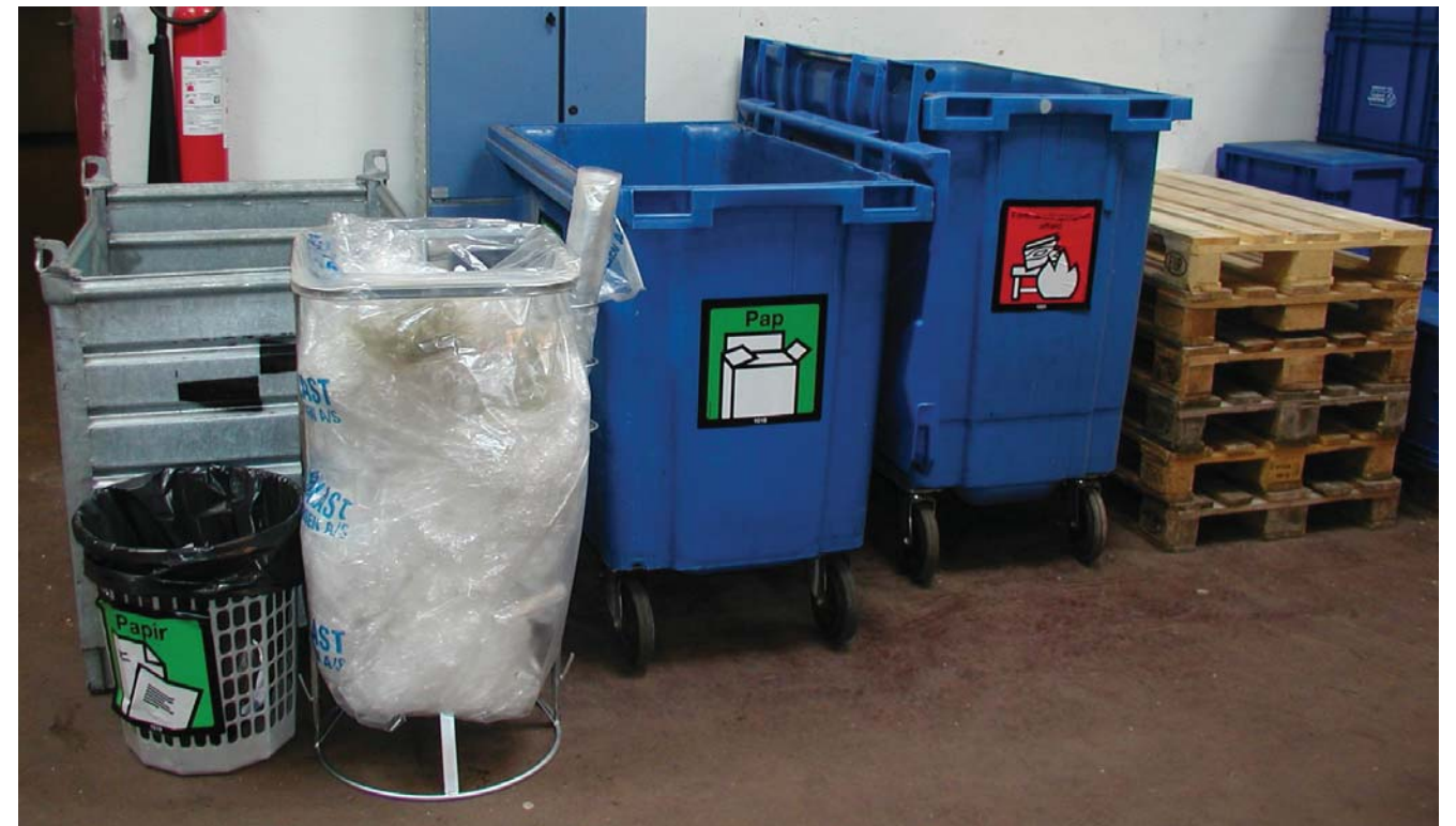
Brøndby Kommunes Trykkeri april 2012