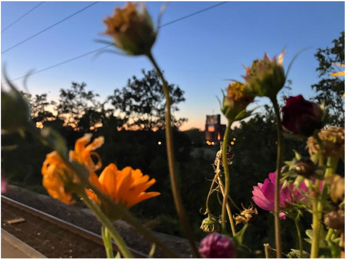
Aftenstemning fra Strandboxen under Kulturnatten i Brøndby Strand den 4. oktober