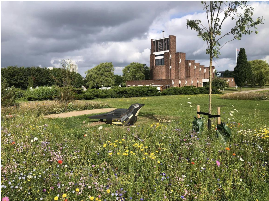
Brøndby Strands nye naturhave blev indviet den 5. september i år. Haven signalere den forandring der er på vej i bydelen.